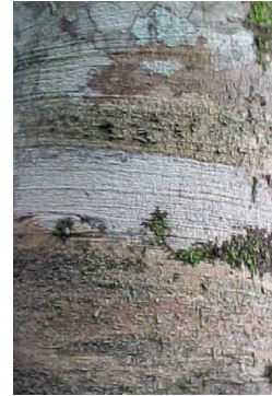
Figura 3: "Rabo itá" Corteza con diseño áspero y lenticelas en hileras transversales