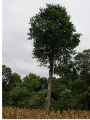
Figura 2: "Rabo itá" Forma forestal, habito de copa alta, copa orbicular.