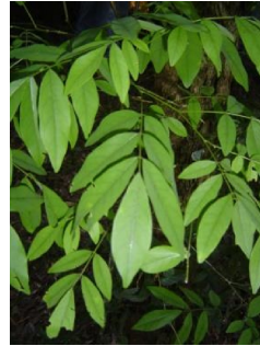
Figura 5: Vista del rámulo del "Rabo itá".