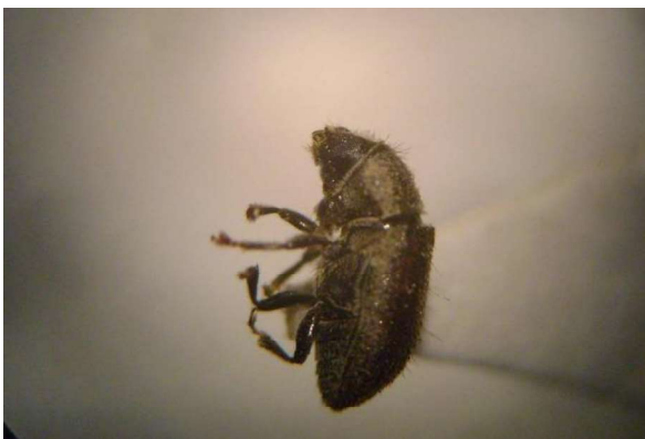
Figura 6. Vista de perfil de Sinophloeus destructor Figure 6. Profile view of Sinophloeus destructor