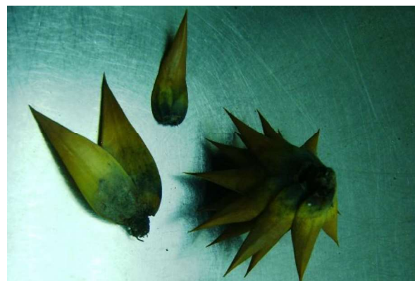
Figura 3. Síntomas de necrosis apical en ramas de Araucaria araucana . Figure 3. Symptoms of apical necrosis on branches of Araucaria araucana .