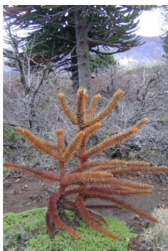
Figura 2. Renovales muertos de Araucaria araucana Figure 2. Dead young trees of Araucaria araucana