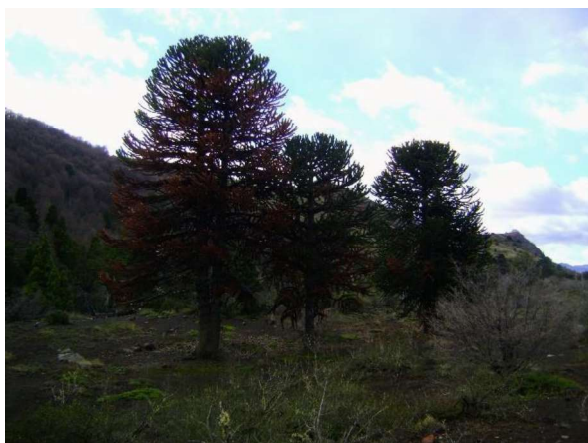
Figura 1. Ejemplares adultos de Araucaria araucana con síntomas de decaimiento Figure 1. Decay symptoms on adult trees of Araucaria araucana

las ramas (principalmente basales) con hojas necróticas y cloróticas, hojas con manchas cloróticas y necróticas, y pequeños rebrotes cloróticos emergiendo de las mismas. Por otra parte, se encontraron árboles adultos con un viraje de color a castaño rojizo en ramas de la parte basal y hasta la parte media de la copa y otros con el mismo síntoma alcanzando en forma irregular la parte superior de la copa (Figuras 1). Se visualizaron también árboles muy jóvenes, de 4 a 5 años de edad, con la copa totalmente afectada (Figura 2). En los sitios más afectados se pudo determinar que la distribución espacial de la enfermedad era de forma agregada. Al tomar muestras de las ramas de color castaño rojizo se constató que los ápices se desarmaban fácilmente y que la base de las hojas y el sitio de inserción de las hojas en las ramas estaban totalmente necrosados y desagregados (Figura 3). Además, se detectó una atrofia pronunciada de conos femeninos en algunos ejemplares adultos.