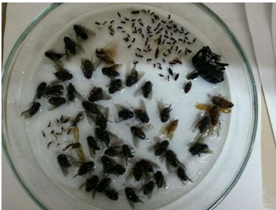
Figura 5. Resultado de una captura con la trampa embudo Lindgren Figure 5. Results of a capture with a lindgren funnel trap