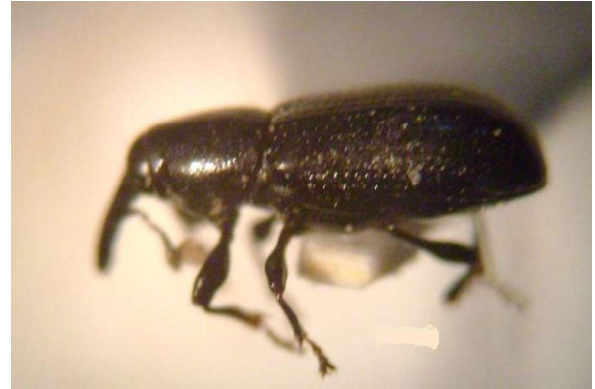
Figura 7. Vista de perfil de Araucarius sp Figure 7. Lateral view of Araucarius sp